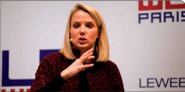
خانم مایر جزو ۲۰ کارمند اول گوگل و یکی از بزرگترین سرمایه‌های این شرکت بزرگ اینترنتی به حساب می‌آمده است که اکنون مدیریت یاهو را به عهده دارد

ما وارد بخش سخت‌افزار نخواهیم شد و بیشتر به این فکر هستیم که این امکان وجود داشته باشد که تمام سرویس‌های یاهو به راحتی روی تلفن‌های هوشمند و معمولی در دسترس بوده و هر کاربری بتواند به آسانی آن‌ها را تجربه کند.